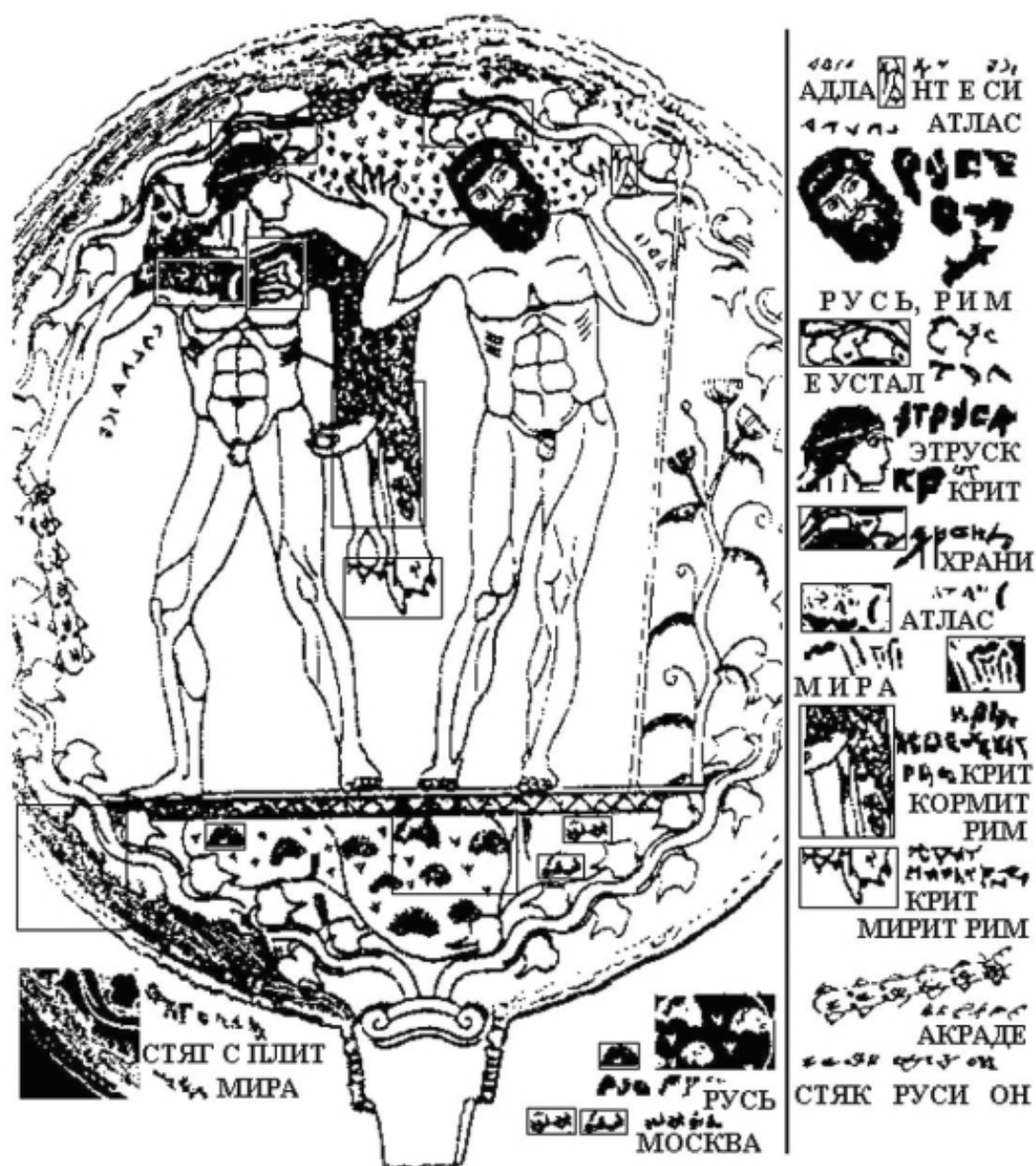
Рис. 2. Мое чтение надписей на одном из этрусских зеркал

Чтение явной надписи будет, как обычно, справа налево. Правое слово АДЛА не дописано, недостающие буквы Н и Т помещены в маленькой рамочке у кисти левой руки Атланта. Тем самым, полное слово гласит: АДЛАНТ , то есть АТЛАНТ (первое Т произносится у этрусков озвонченно). Второе слово распадается на Е СИ АТЛАС , то есть ВОТ ЭТО – АТЛАС . Слово АТЛАС может иметь в данном случае два значения: АТЛАССКИЕ ГОРЫ и СБОРНИК КАРТ . Какой из них следует употребить, будет ясно из дальнейшего рассмотрения. Таковы явные надписи.